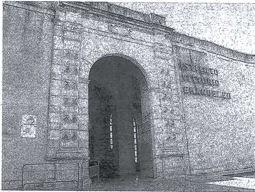
GIOVINAZZO L'ingresso dell'Istituto Vittorio Emanuele dove sono allocati i servizi e gli uffici della Asl

rà così molti dei servizi erogati dalla Asl. Gli utenti per le singole esigenze, saranno costretti a trasferimenti presso sedi che saranno tutte da individuare. Un danno non soltanto per i servizi che verranno meno ma anche per l'indotto, seppur minimo, che la Asl con la sua presenza sul territorio è riuscita a creare.